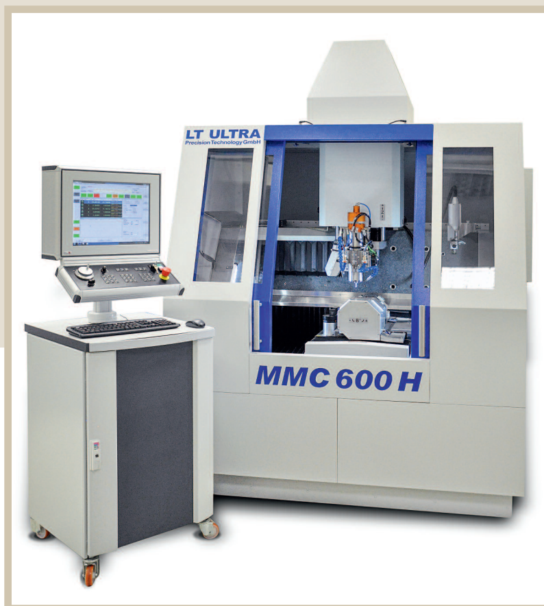
Bild 3. Ultrapräzisionsfräsmaschine MMC-600H für das 5-Achs-Simultanfräsen

steuerung ohne zusätzliche Servos oder FPGAs. Zusätzlich müssen die hohen Auflösungen über Messbereiche von teilweise mehreren Metern berücksichtigt werden, weswegen gängige Maschinensteuerungen hinsichtlich der Positionsregelung an ihre Grenzen stoßen.