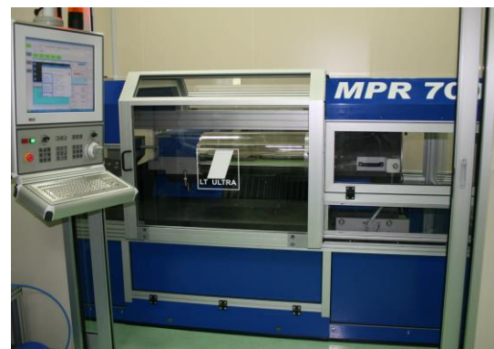
Abb.2: Masterprofilometer MPR 700 von LT Ultra